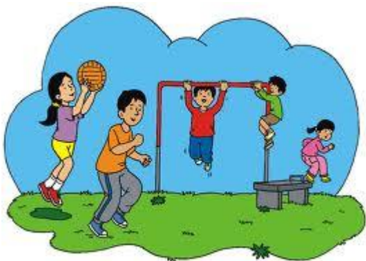
Acople de movimientos