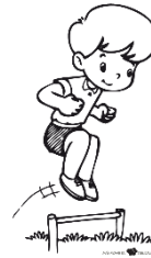
Saltos desde altura mínima