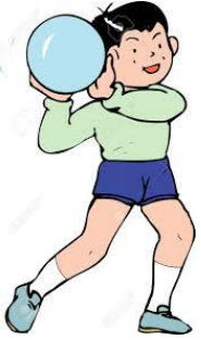
Lanzamiento de Balón