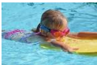
Desplazamientos con tabla