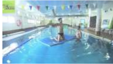
Equilibrio en colchoneta