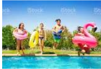
Entradas al agua